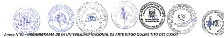
Anexo N°01 - ORGANIGRAMA DE LA UNIVERSIDAD NACIONAL DE ARTE DIEGO QUISPE TITO DEL CUSCO